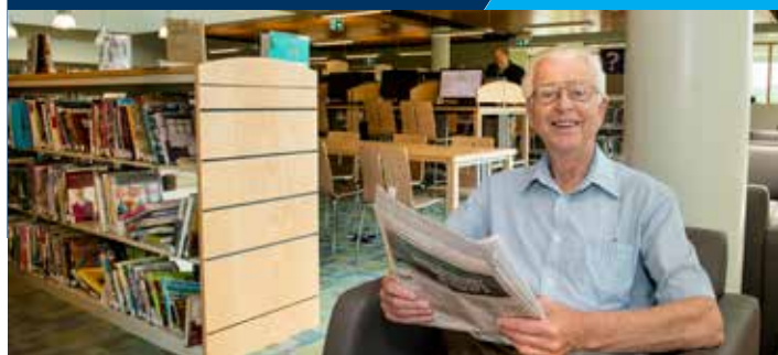
Autorisation d'utilisation : South Shore Public Libraries

AVR – Annapolis Valley Regional Library CBR – Cape Breton Regional Library CEH – Colchester-East Hants Public Library CPL – Cumberland Public Libraries ECR – Eastern Counties Regional Library HPL – Halifax Public Libraries PAR – Pictou-Antigonish Regional Library SSP – South Shore Public Libraries WCR – Western Counties Regional Library